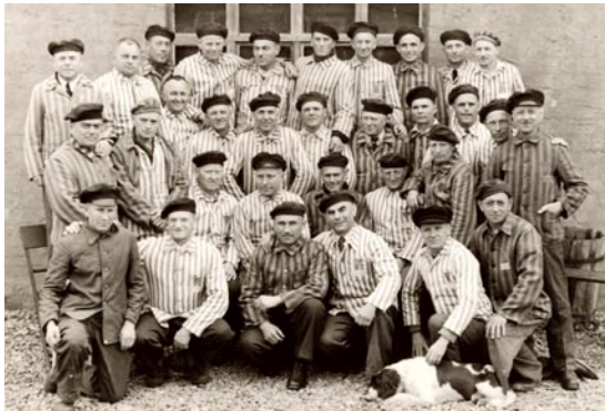
Befreite Häftlinge des „Restkommandos“, Wewelsburg 1945.

Er selbst zog nach dem Verbot mehrfach ... in Soest und den umliegenden Ortschaften mit der Bibel in der Hand von Haus zu Haus und missionierte. ... Für die Schriften, die er beim Missionieren abgab, erhielt er gelegentlich kleinere Beträge. 1 ... Das Geld war für die „Gute Hoffnungskasse“ bestimmt ... zur Unterstützung notleidender Glaubensge-