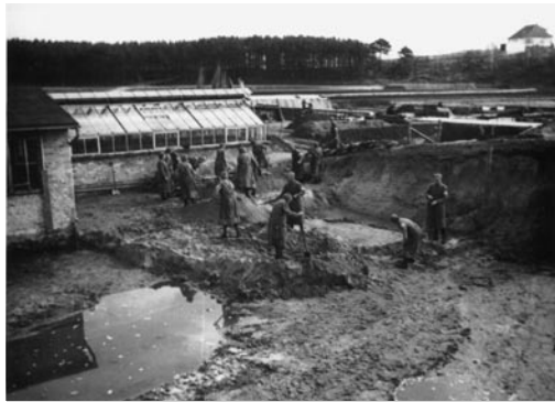
Schwere Häftlingsarbeit bei den Gewächshäusern der Gärtnerei, KZ Ravensbrück 1940/41.