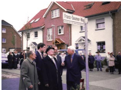
„Franz-Saumer-Weg“ in Moers, Straßenschildübergabe, 28.4.1999. (Das Foto ist auch in der Ausstellung und im Katalog der „Stiftung Denkmal für die ermordeten Juden Europas“ in Berlin zu sehen.)