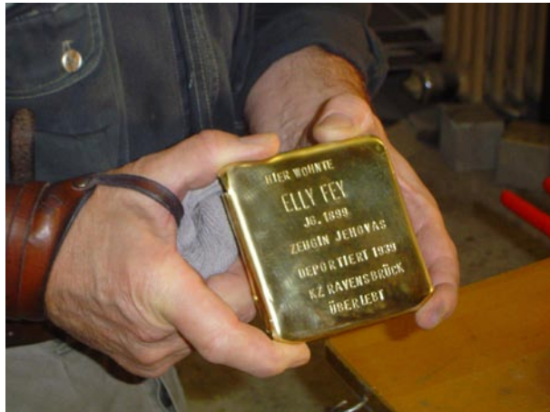
„Stolperstein“-Verlegung in Köln, 2004.

Zur Erinnerung an diese standhafte Frau wurde im Oktober 2004 in Köln auf dem Gehweg vor ihrem Wohnhaus in der Wilhelmstraße 58 ein „Stolperstein“ mit ihrem Namen und dem Hinweis „Zeugin Jehovas“ verlegt.